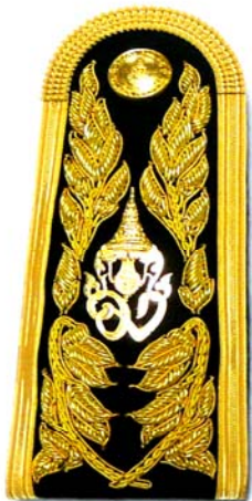
รูปแบบที่ ๒ อินทรธนู