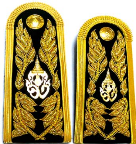
รูปแบบที่ ๕ อินทรธนูชายและหญิง