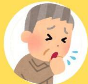
ချောင်းဆိုးခြင်း