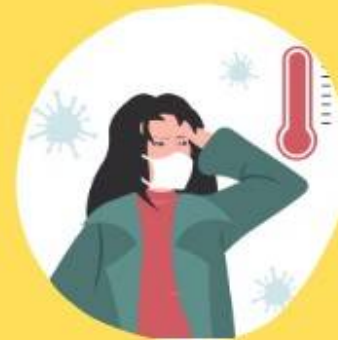
ဖျားခြင်း

ကိုရိုနာဗိုင်းရပ်စ်ရောဂါသည် အသက်သေဆုံးသည်အထိ ဖြစ်နိုင်ပါသည်။ သင်သည် လွန်ခဲ့သော (၁၄) ရက်အတွင်း တရုတ်နိုင်ငံ (သို့) လတ်တလော အသက်ရှူလမ်းကြောင်းဆိုင်ရာရောဂါ (Covid-19) ကူးစက်ပြန့်ပွားသေဆုံးမှုနှုန်း မြင့်မားနေသော နိုင်ငံတစ်ခုခုသို့ ခရီးသွားခဲ့သည့်ရာဇဝင်ရှိခြင်း နှင့် ဖော်ပြပါရောဂါလက္ခဏာများ ထဲမှ တစ်ခု(သို့) တစ်ခုထက်ပို၍ ဖြစ်လာခြင်းရှိပါက ဆေးရုံသို့ ချက်ချင်းသွားပါ။ အခြားနိုင်ငံတစ်ခုခုသို့ခရီးသွားရောက်ခဲ့ပြီး အဆိုပါရောဂါလက္ခဏာများ ရှိပါက မိမိ၏နေအိမ်၌ (၁၄) ရက် သီးသန့်နေထိုင်သင့်ပါသည်။ အကယ်၍ မသက်သာပါက ဆေးရုံသို့ ချက်ချင်း သွားရန်လိုအပ်သည်။