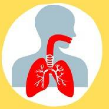
ពិបាកដកដង្ហើម