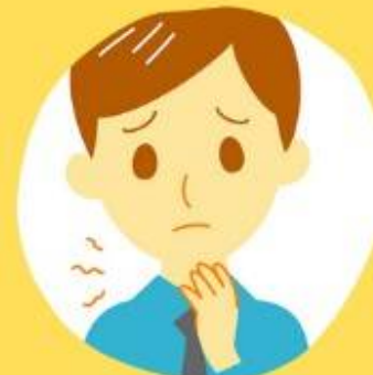
လည်ချောင်းနာခြင်း