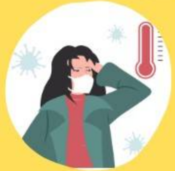
ក្តៅខ្លួន

វីរុសកូរ៉ូណាអាចទៅវាយប្រហារលើសួតរបស់អ្នក ហើយករណីមួយចំនួនអាចបណ្តាលអោយស្លាប់បាន។ ប្រសិនបើលោកអ្នកមានអាការៈដូចជា ក្តៅខ្លួន ក្អក ឈឺក ហៀរសំបោរ និងពិបាកដកដង្ហើម បន្ទាប់ពីមានការសង្ស័យមានប៉ះពាល់អ្នកមានអាការៈដូចខាងលើ ឬទើបត្រលប់មកពីប្រទេសចិន ឬធ្លាប់មកពីបណ្តាប្រទេសដែលមានការចម្លងកូវីដ-១៩ (COVID-19) អ្នកគួរតែដាក់ខ្លួនឯងអោយនៅដាច់ដោយឡែកពីគេ ឬក៏អ្នកអាចដាក់ខ្លួនឯងអោយនៅដាច់ដោយឡែកចំនួន ១៤ ថ្ងៃ នៅផ្ទះរបស់ខ្លួន។ ប្រសិនបើមានមិនធូរស្រាល សូមប្រញាប់ទៅមន្ទីរពេទ្យជាបន្ទាន់ និងជូនដំណឹងដល់បុគ្គលិកសុខាភិបាល។