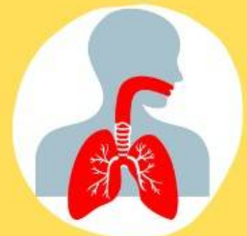
အသက်ရှူရခက်ခဲခြင်း