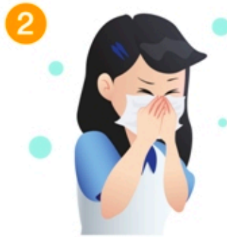
2 ปิดจมูก ปาก เวลาไอ จาม โดยใช้ทิชชู ไม่ใช่มือเปล่า