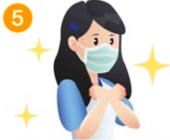
5 ไม่ควรใช้มือสัมผัสบริเวณ ตา จมูก และปาก ถ้าไม่จำเป็น