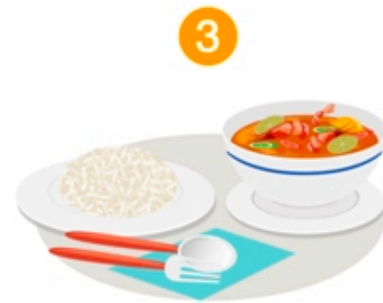
3 กินอาหารสุกและสะอาด