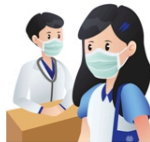
8 หากสงสัยว่าป่วยโรคนี้ ให้สวมหน้ากากอนามัย และรีบมาพบแพทย์

สามารถติดตามสถานการณ์การระบาดของไวรัสโคโรนาสายพันธุ์ใหม่ 2019 ได้ที่ website ขององค์การอนามัยโลก ( https://www.who.int/emergencies/diseases/novel-coronavirus-2019 )