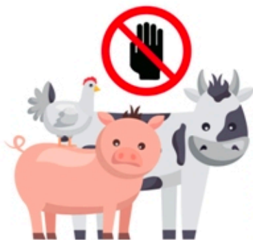
7 ไม่สัมผัสกับสัตว์ป่า หรือสัตว์เลี้ยงในฟาร์ม (โดยเฉพาะสัตว์ป่วย หรือตาย)