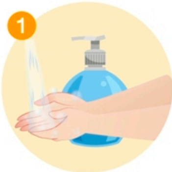
1 ล้างมือบ่อยๆด้วยสบู่และน้ำ หรือ แอลกอฮอล์ล้างมือ