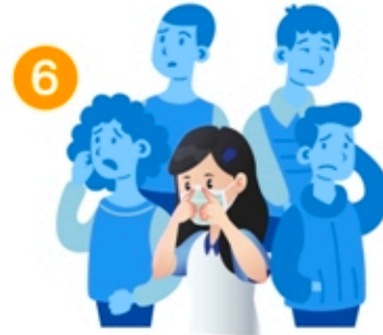
6 ไม่อยู่ใกล้ชิดกับผู้ที่มีอาการหวัด หากเสี่ยงไม่ได้ให้สวมหน้ากากอนามัย