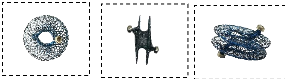
อุปกรณ์ถ่างขยายผนังหัวใจห้องบนต้นแบบ

ใจเต้นเร็วผิดปกติ, บวมน้ำตามข้อเท้า, บวมน้ำในปอด และอาจถึงขั้นเสียชีวิต โดยแนวทางการรักษาจะทำการรักษาตามอาการเช่น การให้ยาขยายหลอดเลือด, การให้ยาช่วยการทำงานของกล้ามเนื้อหัวใจ, การให้ยาลดอาการบวมน้ำ และการผ่าตัด วิธีการรักษาในแบบต่าง ๆ อาจมีผลกระทบทำให้ระบบภายในร่างกายทำงานหนักขึ้น รวมถึงผลกระทบจากการผ่าตัด อาจทำให้ผู้ป่วยมีอาการทรุดลง ทางคณะวิจัยจึงมีแนวคิดที่จะใช้อุปกรณ์ที่ช่วยในการเจาะผนังกันหัวใจห้องบน เพื่อลดความดันภายในหัวใจห้องบนซ้าย ซึ่งช่วยลดภาระการทำงานของหัวใจ ทำให้หัวใจของผู้ป่วยสูบฉีดเลือดได้สะดวกและมีชีวิตความเป็นอยู่ที่ดีมากยิ่งขึ้น โดยอุปกรณ์นี้มีชื่อว่า Atrial Flow Regulator (AFR) หรือ Interatrial Shunt Device (IASD) เป็นอุปกรณ์ที่ผลิตจากวัสดุผสมจำรูป (Shape memory alloy) ซึ่งทำมาจากโลหะผสมระหว่างนิกเกิล-ไทเทเนียม (NiTi) ที่มีความสามารถจดจำรูปร่างและคืนรูปได้ (Shape memory effect) และมีความยืดหยุ่นสูง (Superelastic) จึงสามารถติดตั้งผ่านสายสวนที่มีขนาดเล็ก ๆ ได้ ช่วยลดความเสี่ยงจากการผ่าตัดใหญ่และช่วยให้ ผู้ป่วยสามารถฟื้นตัวจากการรักษาได้อย่างรวดเร็วเมื่อเทียบกับการผ่าตัดเปิดทรวงอก